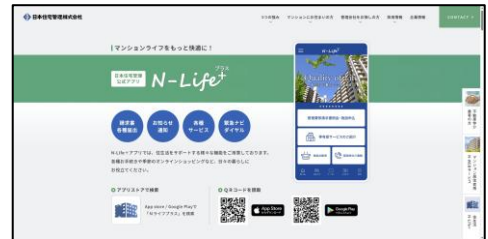
マンションにお住まいの方

同ページでは、日本管財住宅管理および日本住宅管理が提供する、居住者向けマイページサービス「N-WEB」や、暮らしをサポートするサービス「N-Life+」をはじめとする各種サービスへの動線を整備し、日常的なお手続きやお問い合わせをより分かりやすくご案内できる構成としています。