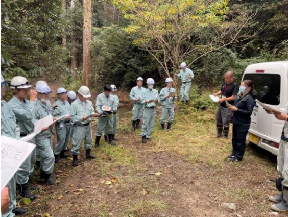
作業前説明の様子

間伐地で、ノコギリで実際に切り倒すなどの間伐業務を行いました。間伐には切捨て間伐と搬出間伐の2種類あり、今回は切捨て間伐でしたが、搬出間伐の場合の木材はノベルティグッズ・お土産・チップとしてバイオマス燃料に活用されます。